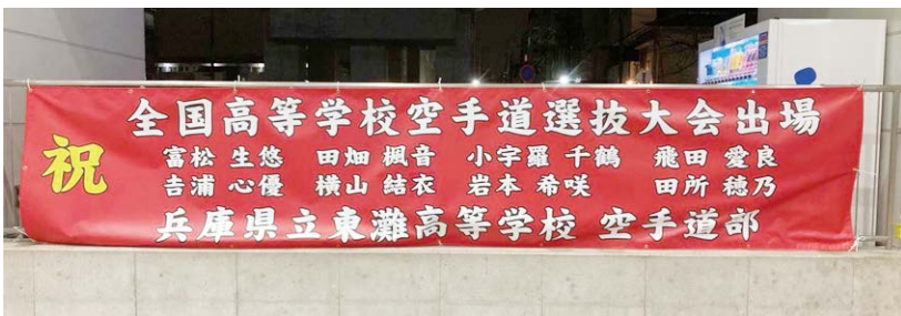
空手道部 全国大会出場