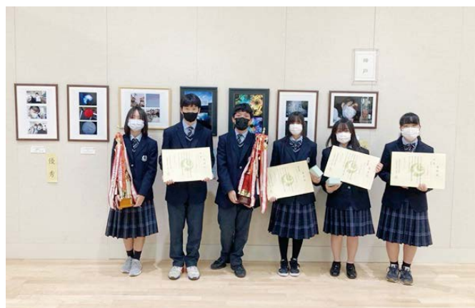
写真部 全国大会出品決定