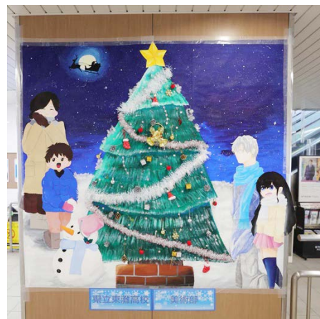
美術部 深江駅作品