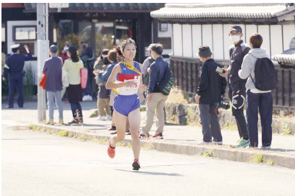
陸上部 県駅伝大会16位